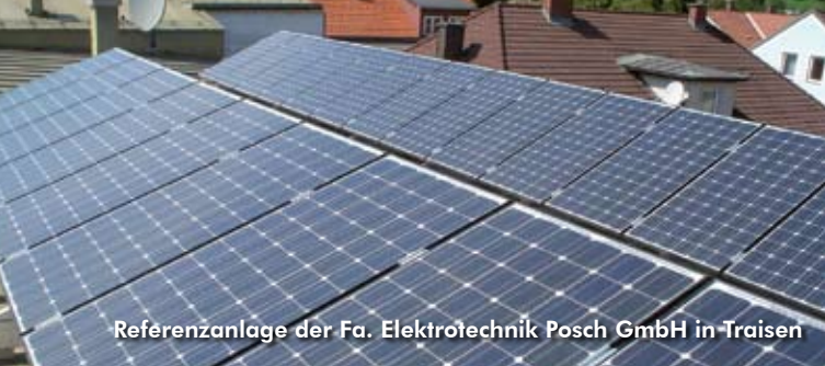
Referenzanlage der Fa. Elektrotechnik Posch GmbH in Traisen